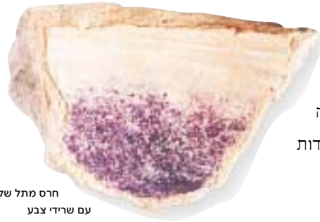
חרס מתל שקמונה עם שרידי צבע

גם החפירות הרבות שנעשו לאורך החוף הישראלי של הים התיכון, מקום יצור התכלת, כפי שמעידים חז"ל, לא חשפו תמונה שונה. שרידי צבע שנתגלו בבתי הצביעה והקונכיות השבורות, שנערמו לצדיהם, מעידות על השימוש בחלזון זה בלבד.