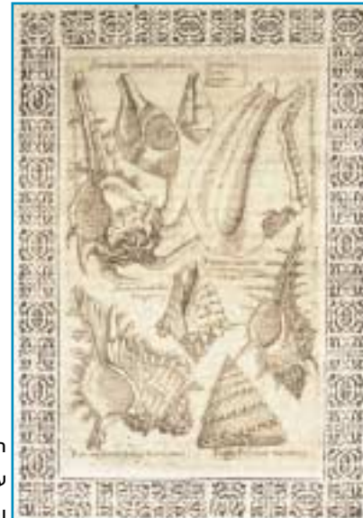
חלזון "פורפורה" על גבי מטבע צורי ובתוך ספר עתיק